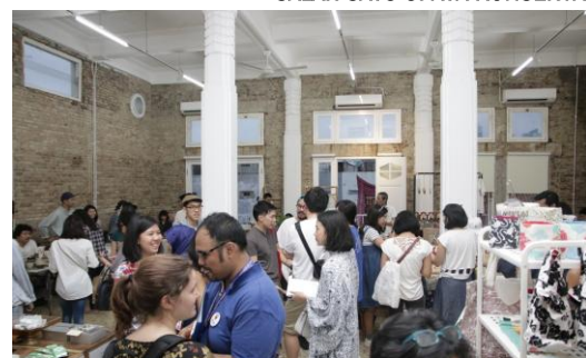
Gambar 07. Pemanfaatan Kawasan Cagar Budaya Sebagai Sarana Edukasi dan Wisata

Sumber : (“Bhirawa,Boy. Signifikansi Pelestarian Arsitektur Presentasi PowerPoint, Ikatan Arsitek Indonesi, 26 Februari 2021.” )