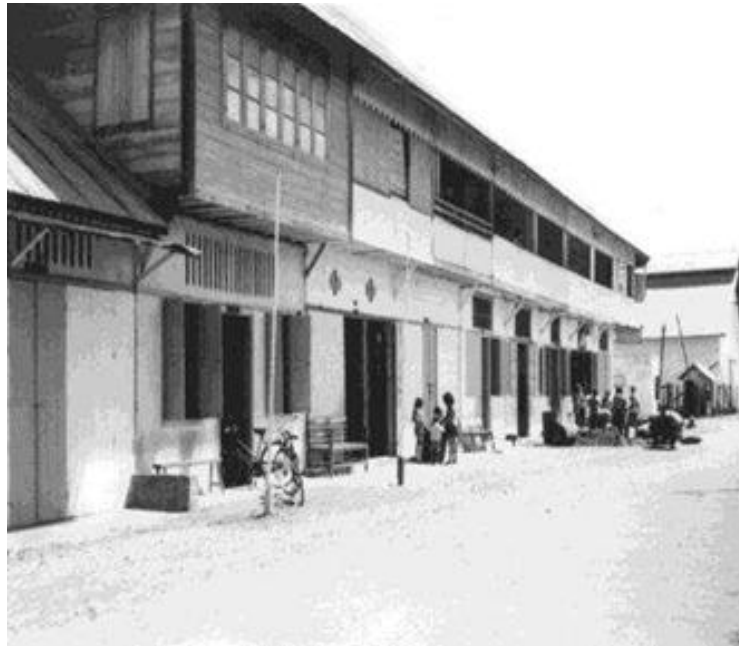
Gambar 02. Bangunan Perbelanjaan Pasar Tua Donggala jl. Mutiara Plabughan Donggala

Dalam perkembangannya, masyarakat Tionghoa membaur dengan penduduk lokal melalui aktivitas perdagangan. Relasi sosial, budaya, dan ekonomi yang terjalin erat menjadikan mereka diterima oleh masyarakat setempat dan dikenal dengan sebutan Cina Donggala . Selama masa kolonial, masyarakat Tionghoa memegang peranan penting dalam bidang ekonomi, termasuk jabatan strategis seperti Kapten Cina, serta mengelola konsesi perkebunan kelapa dan perdagangan hasil bumi.