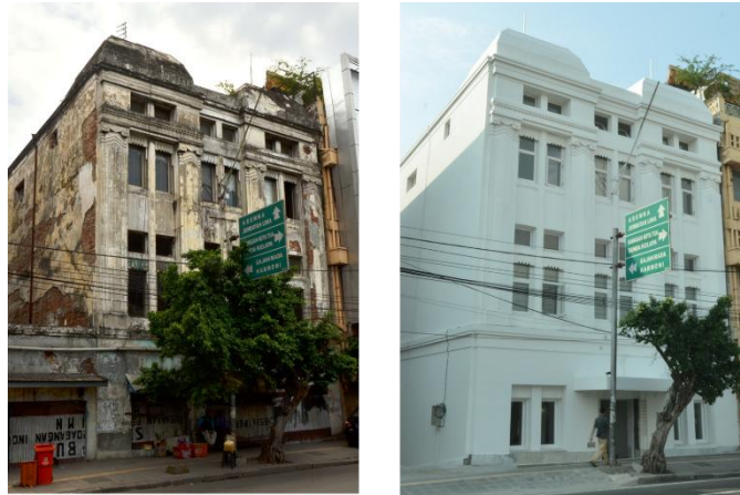
Gambar 06. Contoh Upayah Konservasi dengan Revitalisasi Fisik