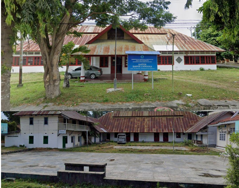
Gambar 05. Tapak Depan dan Belakang Kondisi Bangunan Chung Hwa School

restorasi dan revitalisasi menempatkan situs ini dalam risiko kehilangan nilai sejarah dan budayanya.