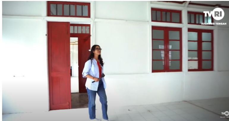
Gambar 08. Pemanfaatan Kawasan Cagar Budaya Sebagai Sumber Pembelajaran Sejarah

Kawasan Heritage Chung Hwa School memiliki potensi besar sebagai sumber pembelajaran sejarah dan budaya. Dengan mengoptimalkan fungsinya sebagai destinasi wisata budaya, kawasan ini dapat memberikan manfaat ekonomi melalui sektor pariwisata. Selain itu, pengenalan nilai sejarah kepada generasi muda dapat memperkuat identitas lokal dan memperkaya wawasan tentang keberagaman budaya.